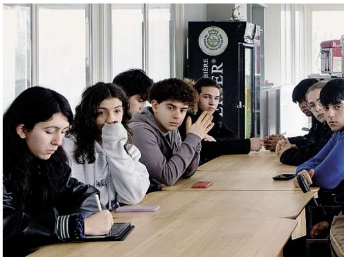
Riunione operativa degli studenti delle classi terza e quarta della scuola Castellini